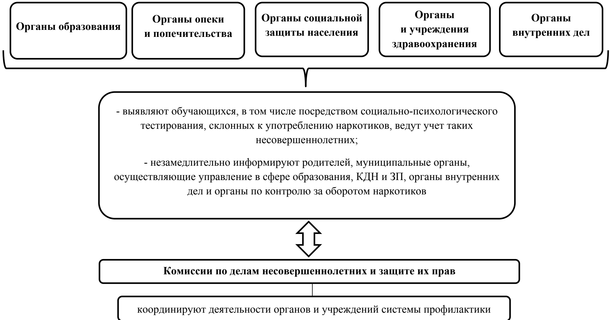
Схема 1. Выявление несовершеннолетних, употребляющих психоактивные и наркотические вещества, субъектами системы профилактики